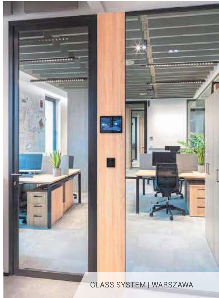
GLASS SYSTEM | WARSZAWA